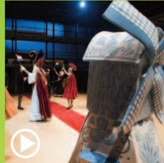
> Tuin van Holland van Toneelgroep De Appel