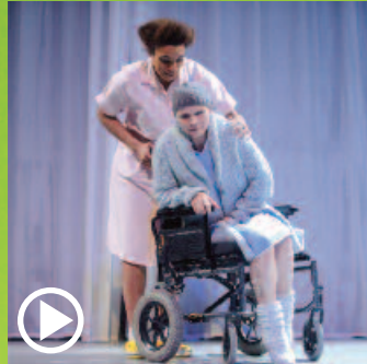
> 'Als de dood...' van V&V Entertainment